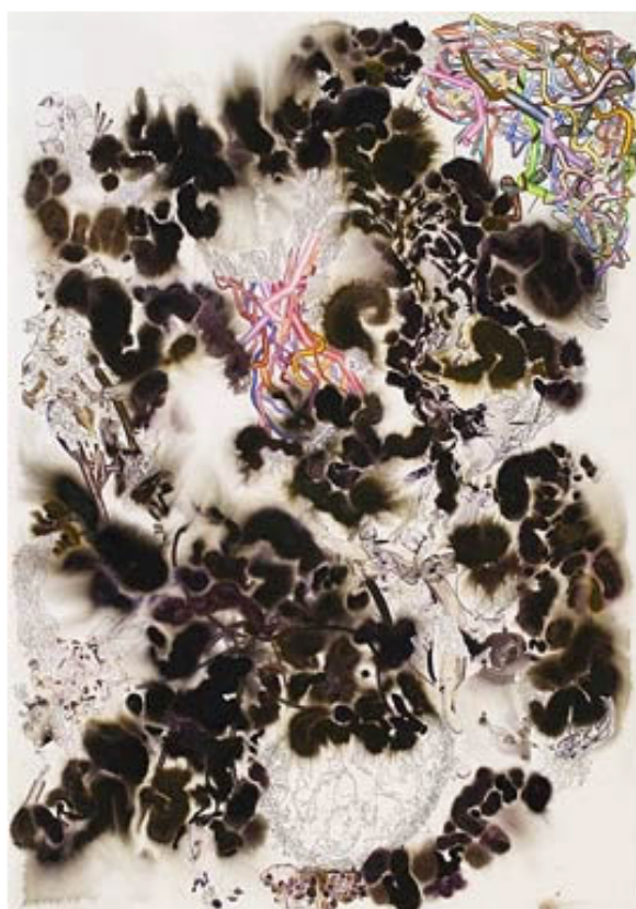
"Ted Jeans" akvarell, 172x124 cm © Erik Jeor